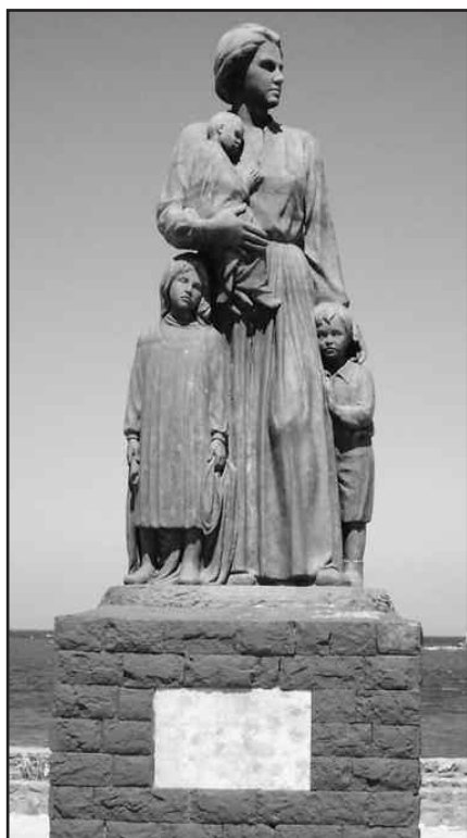
Το άγαλμα της Μικρασιάτικης Μάνας («Η Μητέρα από τη Μικρά Ασία») στο λιμάνι της Μυτιλήνης στη Λέσβο, στην Ελλάδα.

The Greek Government also has asked the United States to permit it to award the Medal of Military Merit to the commanding officers of the twelve American destroyers which assisted in the evacuation of the Greek refugees.